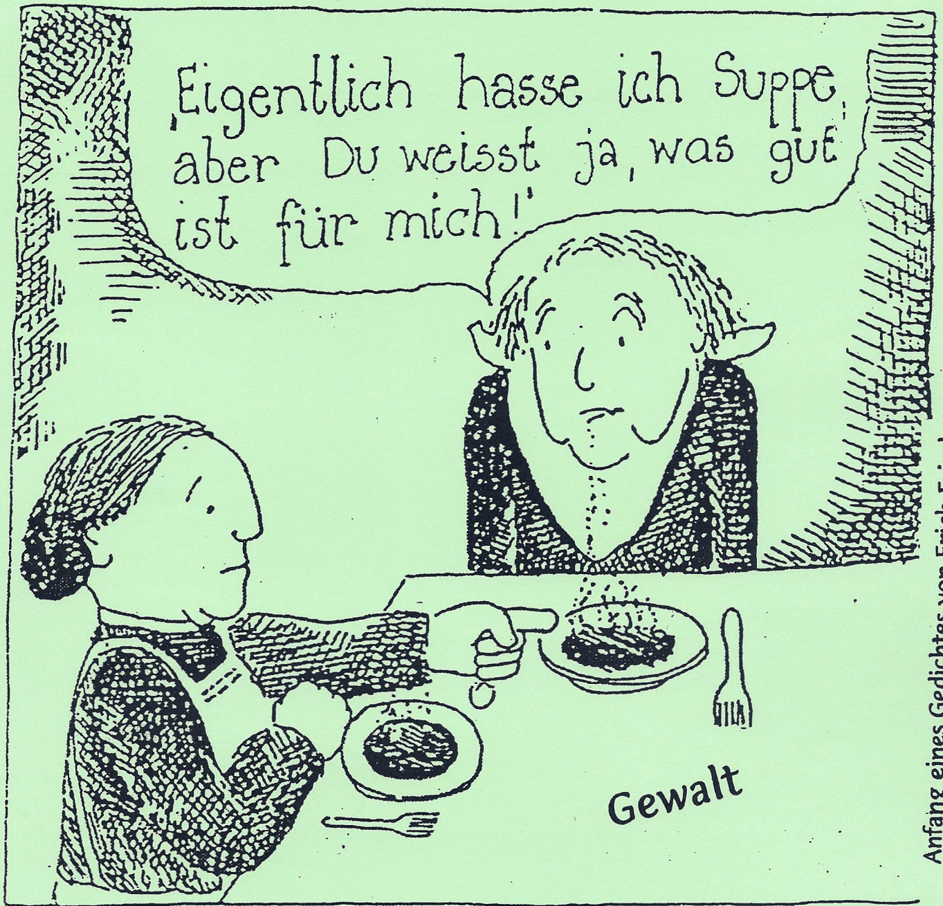
Anfang eines Gedichtes von Erich Fried

Die Gewalt fängt nicht an Wenn Kranke getötet werden Sie fängt an Wenn einer sagt: „Du bist krank Du musst tun, was ich dir sage“